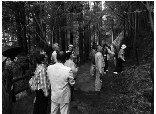
ภาพที่ 6 บรรยากาศการท่องเที่ยวบริเวณเหมืองโบราณ

โครงการที่หน่วยงานภาครัฐทำหน้าที่เป็นผู้รับผิดชอบหลักแบ่งออกเป็น 3 ประเภท คือ 1) โครงการปรับปรุงพื้นที่เพื่อรองรับการขยายตัวของการท่องเที่ยว อาทิ การปรับปรุงพื้นที่โบราณสถานเพื่อรองรับนักท่องเที่ยว การทำทางเดินเท้า การสร้างที่จอดรถ เป็นต้น 2) โครงการอนุรักษ์มรดกทางวัฒนธรรมและสภาพแวดล้อมในพื้นที่อิวามิกินซัง เช่น การขุดสำรวจซากเหมืองเงินโบราณใต้ดิน การอนุรักษ์สภาพชุมชนประวัติศาสตร์ เป็นต้น และ 3) โครงการประชาสัมพันธ์การท่องเที่ยว อาทิ การจัดทำเว็บไซต์และแผ่นพับให้ข้อมูลการท่องเที่ยว การจัดกิจกรรมส่งเสริมการท่องเที่ยว เป็นต้น หน่วยงานภาครัฐที่ดูแลโครงการเหล่านี้ คือ อำเภโอดะ โดยแบ่งให้