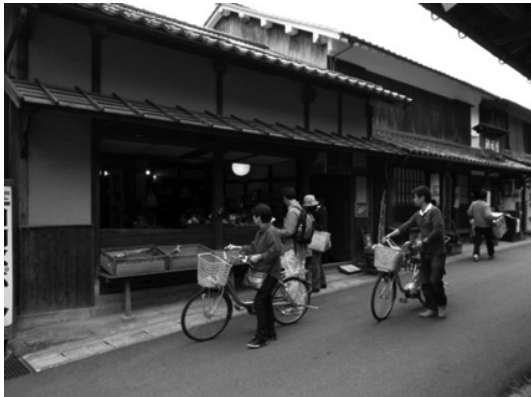
ภาพที่ 5 บรรยากาศการท่องเที่ยวในหมู่บ้านโอโมริ

เอกชน องค์กรภาคประชาสังคม และผู้อยู่อาศัย ภายใต้แผนปฏิบัติการอิวามิกินซัง ทำให้พื้นที่อิวามิกินซังสามารถพัฒนาการท่องเที่ยวภายในพื้นที่และควบคุมผลกระทบจากการท่องเที่ยวที่มีต่อมรดกทางวัฒนธรรมและสภาพแวดล้อมที่อยู่อาศัยได้เป็นอย่างดี (Hayashi 2008; Oguni 2008, 2011; Sataki 2009; Punnoi 2013 )