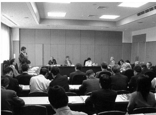
ภาพที่ 3 การอบรมให้ความรู้โดยนักวิชาการ

การดำเนินงานของหน่วยงานภาครัฐและสื่อมวลชนเกิดผลเป็นรูปธรรมอย่างชัดเจนในปี ค.ศ. 2001 ภายหลังจากที่พื้นที่อิวามิกินซังได้รับการบันทึกลงในบัญชีรายชื่อเบื้องต้น (tentative list) ในการเสนอชื่อเพื่อจดทะเบียนมรดกโลก พบว่ามีประชาชนจำนวนมากให้ความสนใจเข้าร่วมฟังการบรรยาย รับการอบรม และมีส่วนร่วมในกิจกรรมต่างๆ เกี่ยวกับพื้นที่อิวามิกินซังอย่างเห็นได้ชัด เกิดการรวมกลุ่มของประชาชนเพื่อจัดทำกิจกรรมส่งเสริมการอนุรักษ์มรดกทางวัฒนธรรมและให้บริการท่องเที่ยว และมีผู้ประกอบการทั้งในและนอกพื้นที่หลายรายเริ่มผลิตสินค้าที่เกี่ยวข้องกับพื้นที่อิวามิกินซังเพื่อต้อนรับนักท่องเที่ยว ในขณะที่เดียนก้องคร์ภาคประชาสังคม