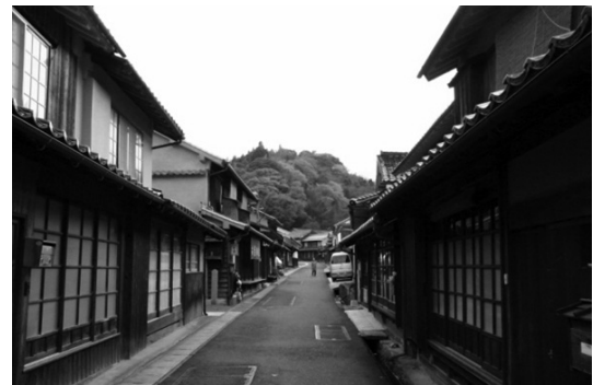
ภาพที่ 2 ทศนียภาพของหมู่บ้านโอโมริ

หน่วยงานภาครัฐ (จังหวัดชิมาเนะและอำเภอโอดะ) จึงตั้งความหวังเป็นอย่างยิ่งกับการพัฒนาการท่องเที่ยวในพื้นที่อิวามิกินซังภายหลังการจดทะเบียนมรดกโลก เพื่อเป็นจุดเริ่มต้นในการฟื้นฟูสภาพเศรษฐกิจและสังคมในพื้นที่ แต่เนื่องจากปัญหาผลกระทบจากการท่องเที่ยวที่เกิดขึ้นในพื้นที่มรดกโลกหลายแห่งทั้งในประเทศญี่ปุ่นและประเทศต่างๆ ในทวีปเอเชีย ทำให้กรมวัฒนธรรม (Agency for Cultural Affairs) ประเทศญี่ปุ่นและองค์การการศึกษา วิทยาศาสตร์ และวัฒนธรรมแห่ง