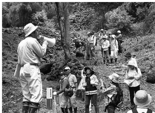
ภาพที่ 4 กิจกรรมทัศนศึกษาพื้นที่อิวามิกินซัง